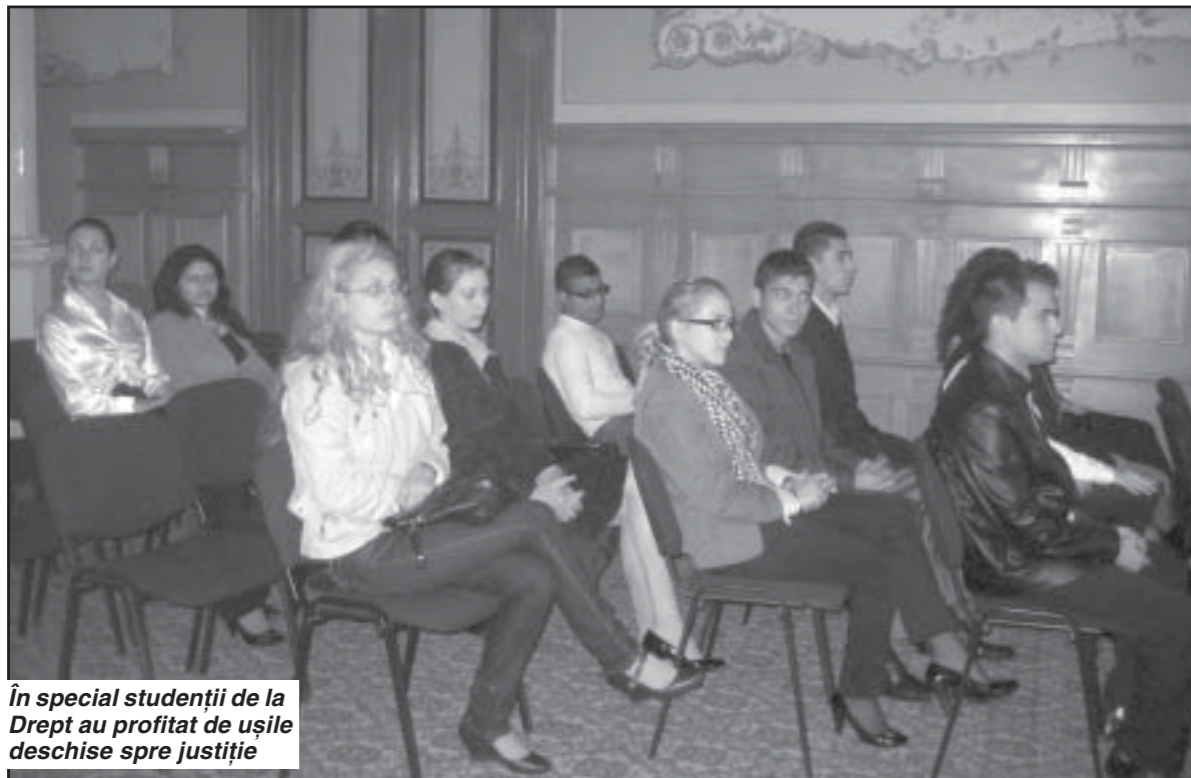
În special studenții de la Drept au profitat de ușile deschise spre justiție

Studentii craioveni au colindat nestingheriți prin birourile judecătorilor și procurorilor și prin sălile de judecată