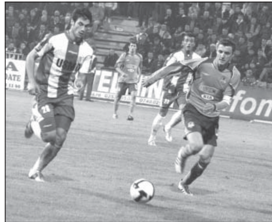
Stadion «Municipal», spectatori 4.000