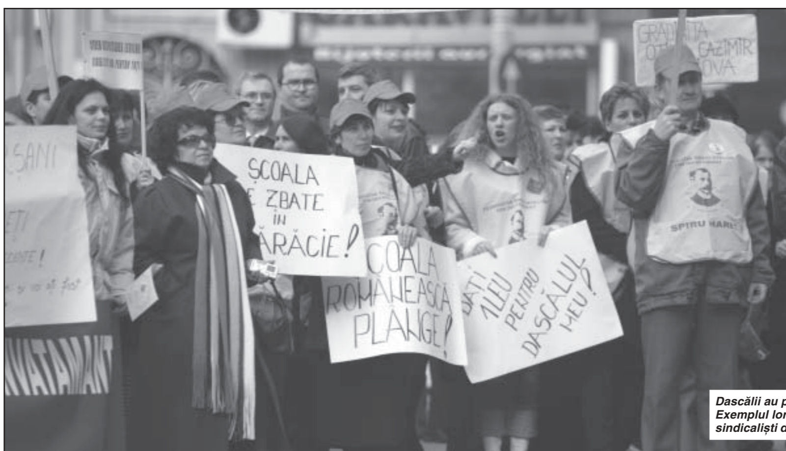
Dascălii au protestat și au câștigat. Exemplul lor este urmat acum de ceilalți sindicaliști din alte ramuri bugetare

"Am făcut multe demersuri până să ajungem în acest punct și așteptăm ca acest act normativ să fie publicat în